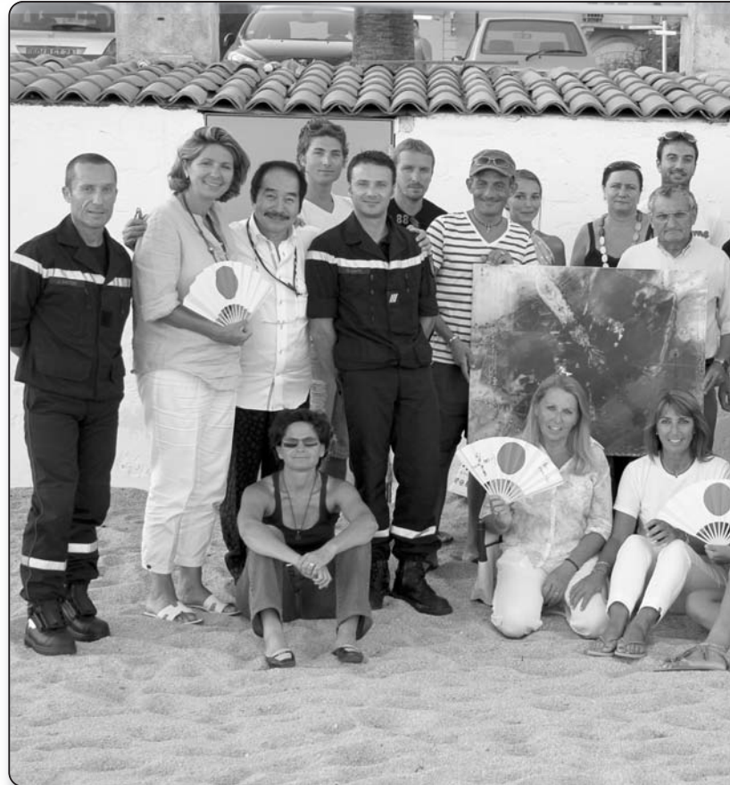
Le comité d'organisation des Journées de La Marie-Do au grand complet

malades du Centre Corse . Pas moins de 15 550 € ont été affectés au projet de création d'un Bureau d'Étude Clinique (BEC) au sein de l' hôpital de Castelluccio , à Ajaccio , pour permettre à certains patients de bénéficier d'une thérapie basée sur les innovations en matière de recherche (essais thérapeutiques), ce BEC ayant été créé en juin 2011 et la formation de l' Attachée de Recherche étant en cours. Par ailleurs, 8 000 € ont servi à la création de deux lits complets «soins palliatifs» pour l' hôpital de Sartène et à l'achat d'une pompe à morphine (livraison en septembre 2011). 4 200 € ont permis à l' Hôpital de Castelluccio d'acquiescer des tables de chevet réfrigérées (livraison en octobre 2011). Enfin, un chèque de 20 000€ a été remis au Professeur Chinot en mars 2011 pour les travaux des ses équipes labellisées au CHU de Marseille .