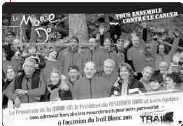
Le second Trail Blanc a rapporté plus de 9 000 € à la Marie Do en 2011, avec 620 participants