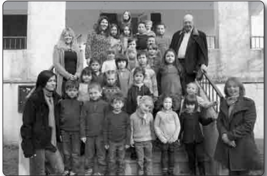
Les élèves et leur équipe pédagogique posent en compagnie de Monsieur le maire

L'outil fait le bonheur des écoliers pour qui le monde des nouvelles technologies a peu de secret. Il a d'ailleurs déjà été mis à profit dans le cadre du projet d'école visant la réalisation d'un diaporama du village, mettant en exergue leur connaissance du patrimoine bâti. La création d'un sentier botanique de référencement des espèces endémiques est également en préparation. Au mois de mai prochain, leur projet d'école sera présenté au musée de Corte , et à n'en pas douter, cela confortera la mairie de Prunu dans ses efforts pour équiper sa petite école du "must" en matière d'apprentissage scolaire, tout comme la Collectivité Territoriale et d' Éducation Nationale , d'avoir investi à bon escient.