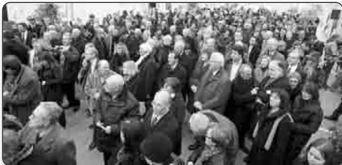
Assistance nombreuse pour la cérémonie de bénédiction avant visite à bord et restauration