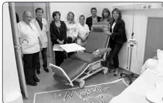
Un fauteuil équipé pour les chimiothérapies de jour à l'hôpital de Corte, équipement financé par La Marie-Do en 2011