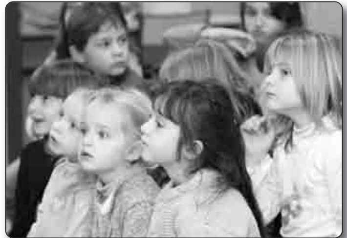
L'interactivité captive les enfants