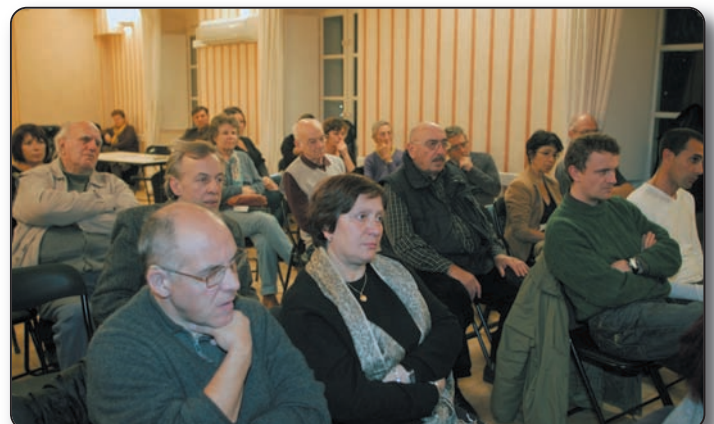
Le public est fidèle aux rendez-vous de l'association