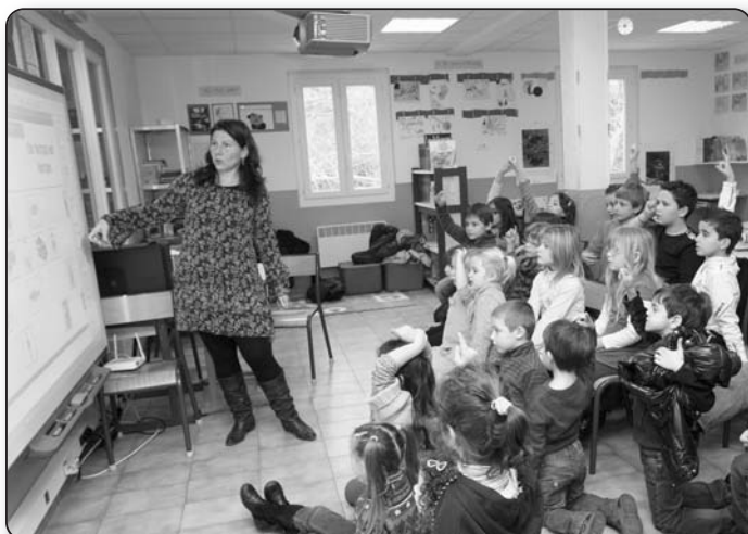
Leçon sur tableau blanc : la manière moderne d'apprendre