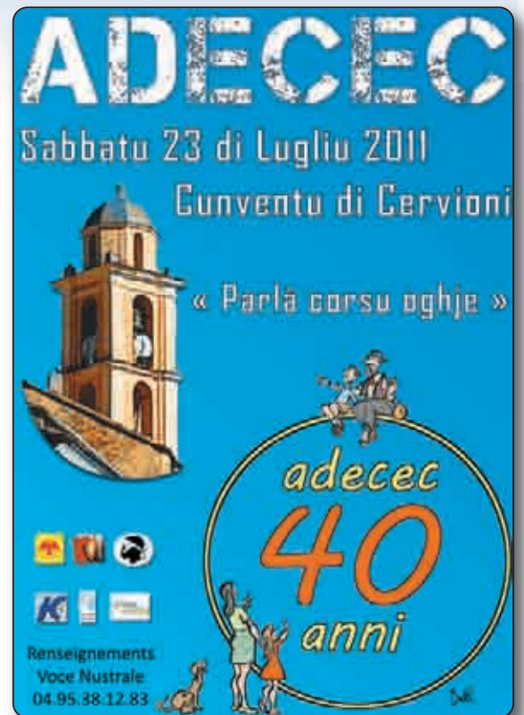
L'affissu di u 40 imu anniversariu

Pour les 40 années à venir, l'association a fait le vœu d'être fidèle à ses engagements de promotion et défense de la langue et de la culture corses en prenant acte de la mutation importante concernant la reconnaissance et le développement de la langue par les instances politique : « Comment ne pas nous en féliciter ? Nous n'avons été qu'une petite pierre de l'édifice, mais cette pierre, nous y tenons, nous la revendiquons ».