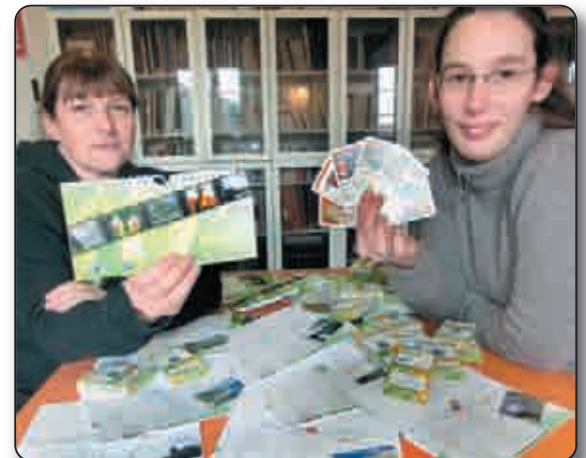
Calendrier et jeu de cartes pour débiter 2012